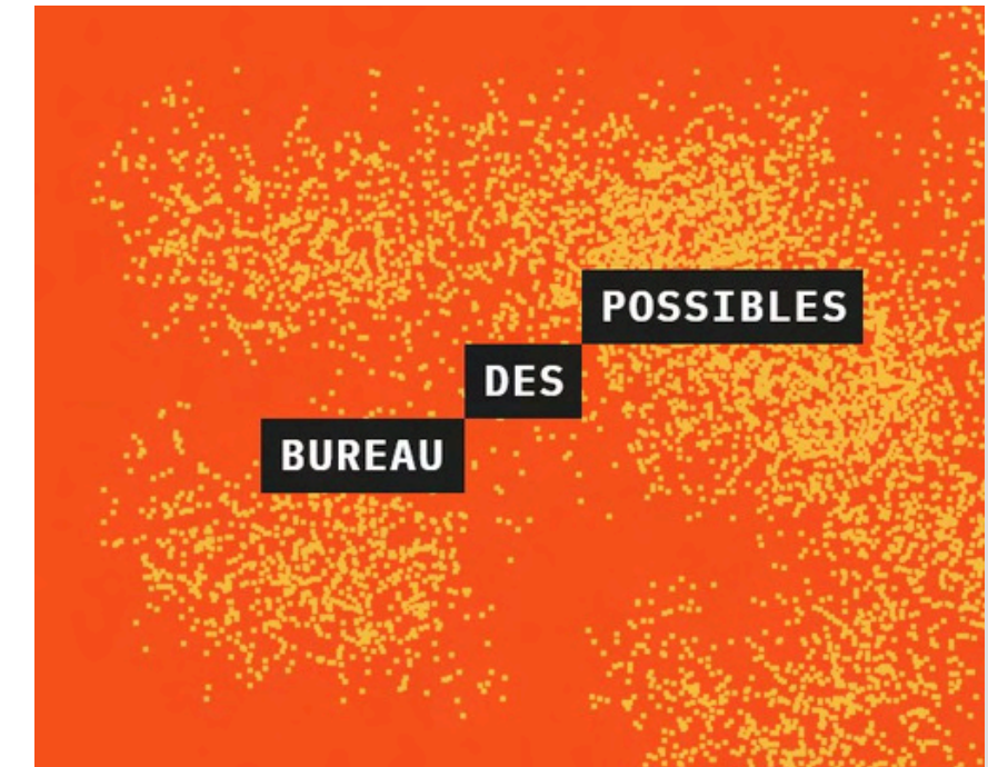
Développement de nos compétences et de nos outils