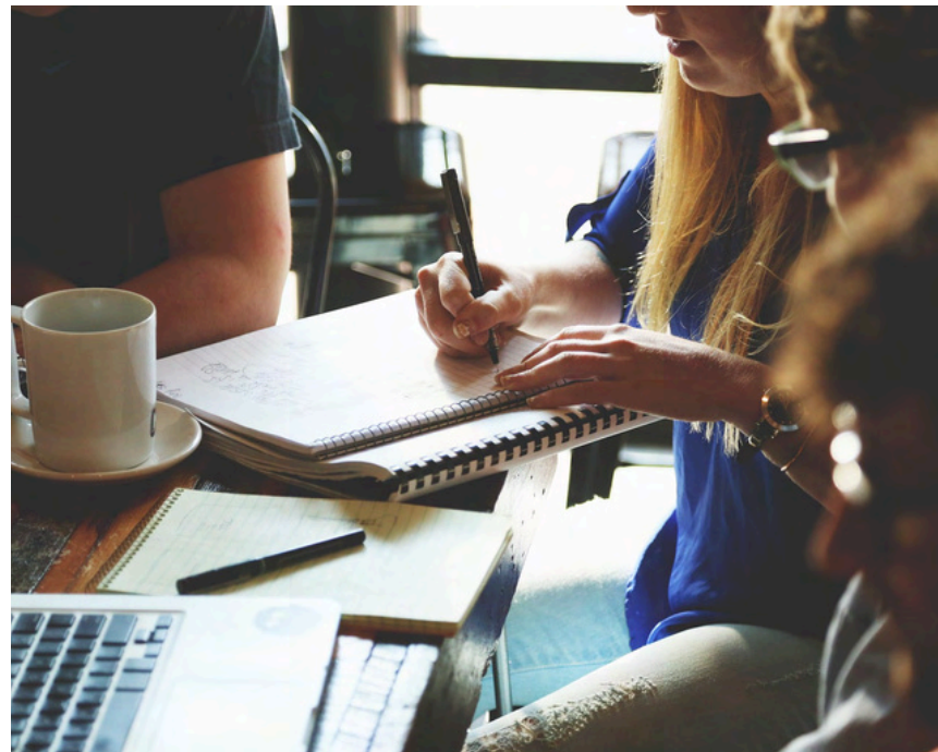
Atelier d'écriture de documents stratégiques

Le service conseil et appui technique au réseau de la BDHV se développe grâce à de nouvelles formes d'accompagnement, de nouveaux outils et le développement de nos compétences.