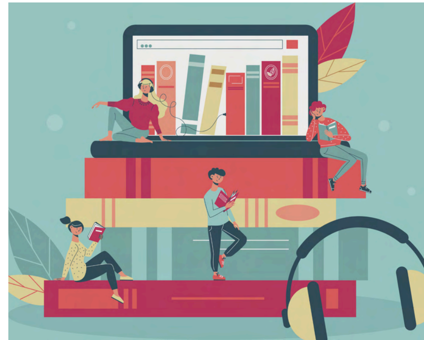
Une rubrique renouvelée sur l'édition adaptée