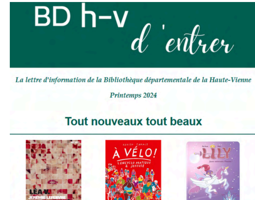
Une lettre d'information pour le public