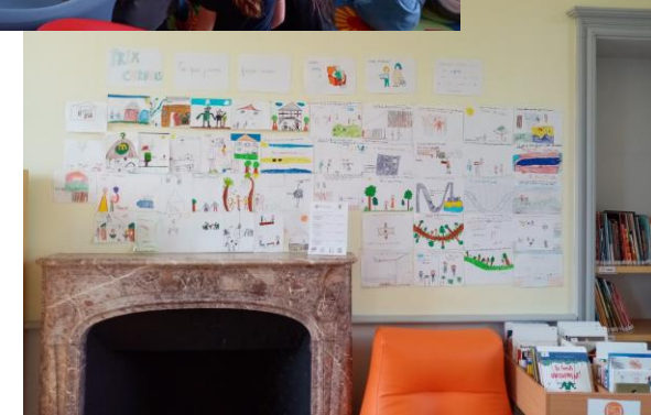
Dessins des enfants