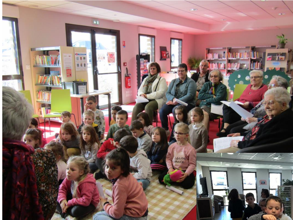
Lecture des albums